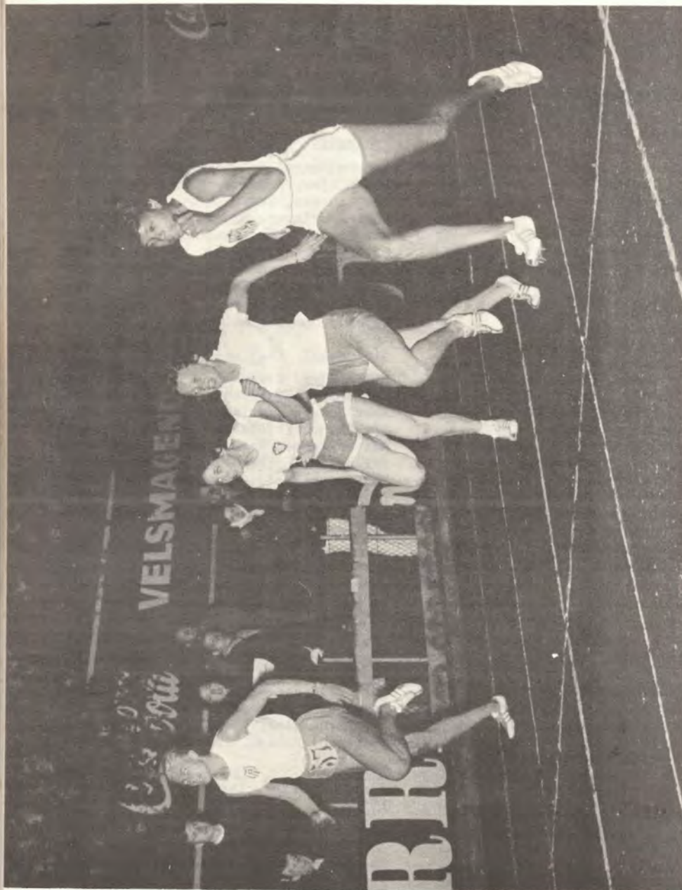
Den 3. september 1962 kom der mange tilskuere på Østerbro stadion for at se Wilma Rudolph løbe.